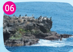
ウミウ生息地 毎年11月から4月にかけて、およそ2千羽ものウミウが越冬のために城ヶ島公園の断崖へやってきます。