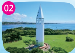
安房崎灯台 令和2年に新設された灯台。城ヶ島灯台と対に建っていることから「恋する灯台」に認定されています。