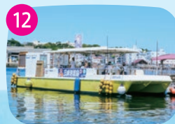
城ヶ島渡船「さんしろ」 三崎産直センター「うらり」と城ヶ島を約5分で結ぶ渡船。自転車やレンタサイクルでの乗船も可能です。