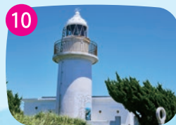
城ヶ島灯台 青空に映える白タイルが爽やかでモダン。関東大震災後に再建された、島のシンボルともいえる灯台です。