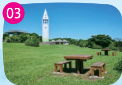
ピクニック広場 テーブルがありピクニックに最適。ランチのあとに島内を巡り、灯台から夕陽を眺めるコースはいいが。