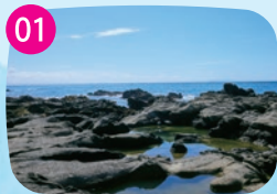
安房崎 島の東側に広がる岩礁地域。貝殻からなる白い砂浜は、貝拾いにぴったり。美しい貝殻を探してみよう。