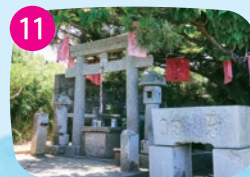
楫(かじ)の三郎山神社 小高い位置にあり、晴れていれば富士山を眺められる。船長を神とし記っているため、大漁祈願で訪れる人も。