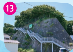
津波避難階段 高齢者や身長差に対応できるように、高さを変えた手すりも、数カ所の踊り場が設けられています。