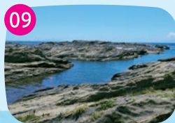
長津呂(ながとろ)崎 岩場が広がり、サンドイッチのような珍しい地層を観察できます。波に気をつけながら磯遊びを楽しんで。