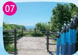
ウミウ展望台 生息地で過ごすウミウの姿を観察できる絶好のスポット。群れをなす様は圧巻。ウミウ像が目印。