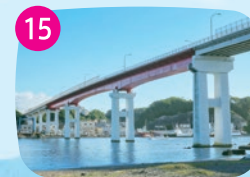
城ヶ島大橋 城ヶ島と三浦半島を結ぶ橋。自転車のほか自転車や徒歩でも渡ることができます。夕暮れ時の景色は必見。