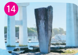
北原白秋詩碑 三浦市に滞在し城ヶ島の詩歌を残した北原白秋。隣には記念館があり、遺作やノート等を展示しています。