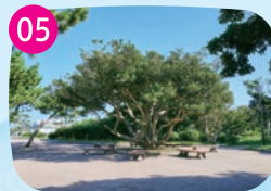
緑陰広場 海風により傾いて育っている松がほどよく日影をつくり、散策中の休憩におすすめのスポットです。