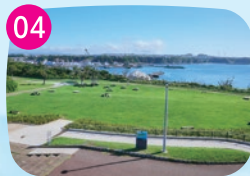
うみのね広場 ゴロゴロとくつろげる芝生広場。高台にあるため見晴らしがよく、三浦半島の景色が楽しめます。