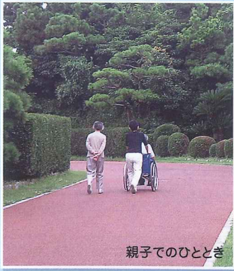
親子でのひととき