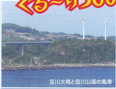
宮川大橋と宮川公園の風車

よく晴れた日の展望台からは、ぐるり360度大パノラマです。 青い海と空が広がり、房総半島や三浦半島、富士・箱根・伊豆の山々、伊豆大島が横たわります。