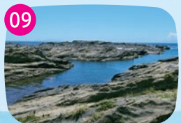
長津呂(ながとろ)崎 岩場が広がり、サンドイッチのような珍しい地層を観察できます。波に気をつけながら磯遊びを楽しんで。