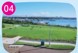
うみのね広場 ゴロゴロとくつろげる芝生広場。高台にあるため見晴らしがよく、三浦半島の景色が楽しめます。