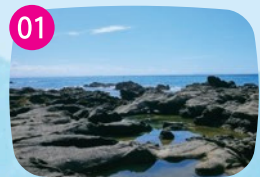
安房崎 島の東側に広がる岩礁地域。貝殻からなる白い砂浜は、貝拾いにぴったり。美しい貝殻を探してみよう。