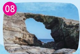
馬の背洞門 長く波に削られて出来た洞門。フォトスポットとして人気ですが、風化が激しく登ることは禁止されています。