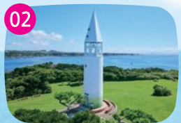
安房埼灯台 令和2年に新設された灯台。城ヶ島灯台と対に建っていることから「恋する灯台」に認定されています。