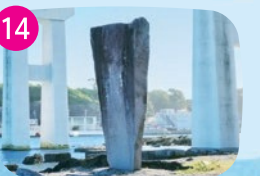
城ヶ島大橋 城ヶ島と三浦半島を結ぶ橋。自動車のほか自転車や徒歩でも渡ることができます。夕暮れ時の景色は必見。