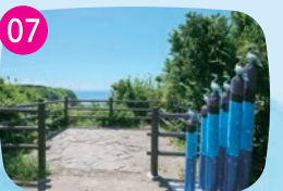
ウミウ展望台 生息地で過ごすウミウの姿を観察できる絶好のスポット。群れをなす様は圧巻。ウミウ像が目印。