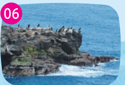
ウミウ生息地 毎年11月から4月にかけて、およそ2千羽ものウミウが越冬のために城ヶ島公園の断崖へやってきます。