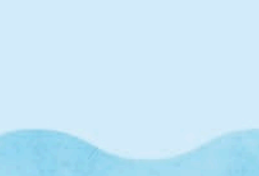
城ヶ島渡船「さんしろ」 三崎産直センター「うらり」と城ヶ島を約5分で結ぶ渡船。自転車やレンタサイクルでの乗船も可能です。