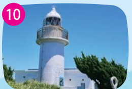
城ヶ島灯台 青空に映える白タイルが爽やかでモダン。関東大震災後に再建された、島のシンボルともいえる灯台です。