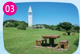
ピクニック広場 テーブルがありピクニックに最適。ランチのあとに島内を巡り、灯台から夕陽を眺めるコースはいかが。