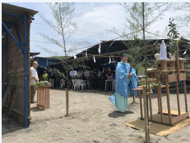
7月3日（水）和田海水浴場

今夏、市内では和田、荒井浜の2か所で海水浴場が開設。先般、各海水浴場で海開き神事が開催され、海の安全を祈願しました。