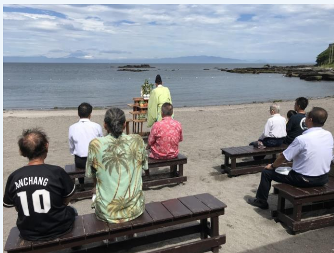
7月19日（金）荒井浜海水浴場