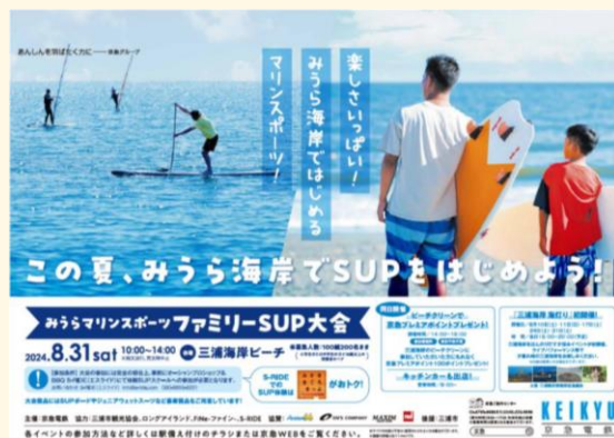
ポスター（イメージ）