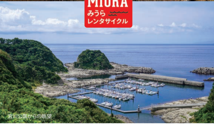
富川公園からの眺望